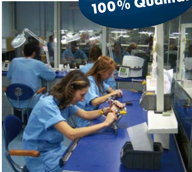
FIFTYDent-Mitarbeiter in unserem hochmodernen Istanbuler Dentallabor.